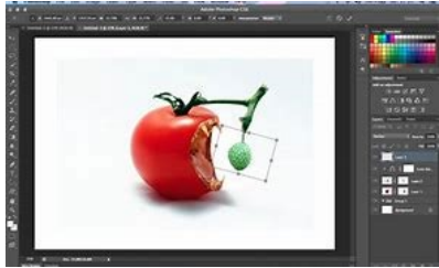
Foto og bilderedigering

Lær å redigere og manipulere bilde og foto